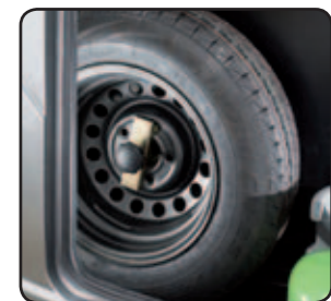
Roue de secours Spare wheel