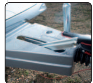
Cache timon (option) Drawbar cover (option)