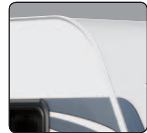
Parois et toit polyester anti-grêle GRP Roof and panels