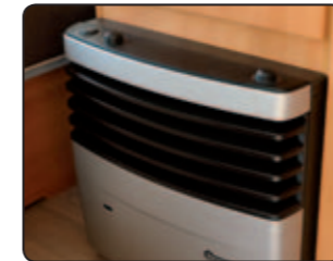
Chauffage gaz TRUMA Gas heater TRUMA