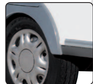
Essieu Alko + amortisseurs Alko axle + Shockabsorbers