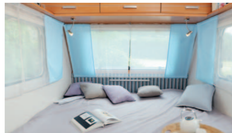
Antarès Luxe 372 "Ocean"