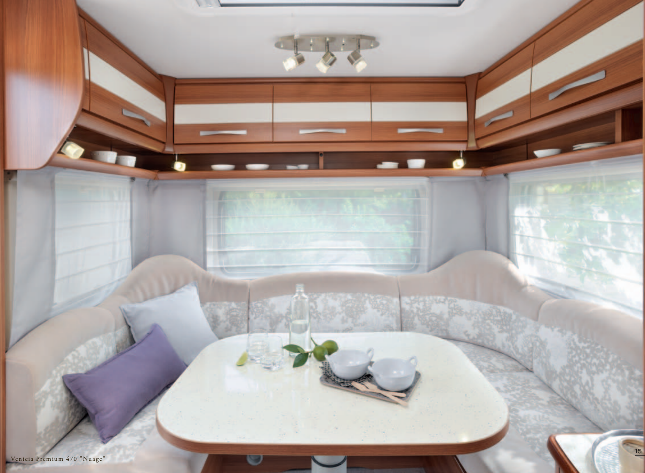
Venicia Premium 470 "Nuage"