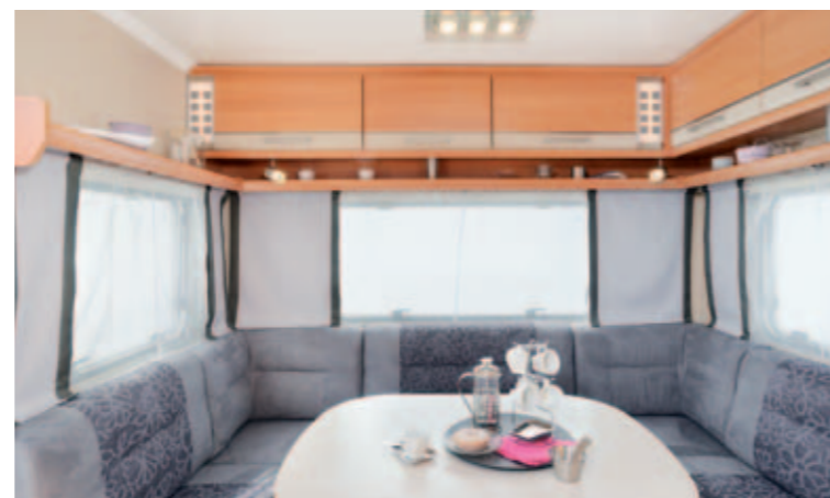
Allegra 450 "Stone"