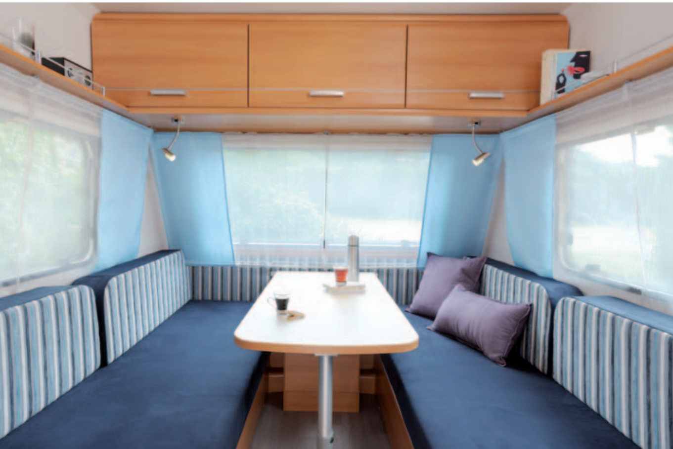
Antarès Luxe 372 "Ocean"