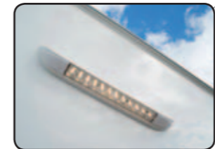
Éclairage d'auvent Awning light