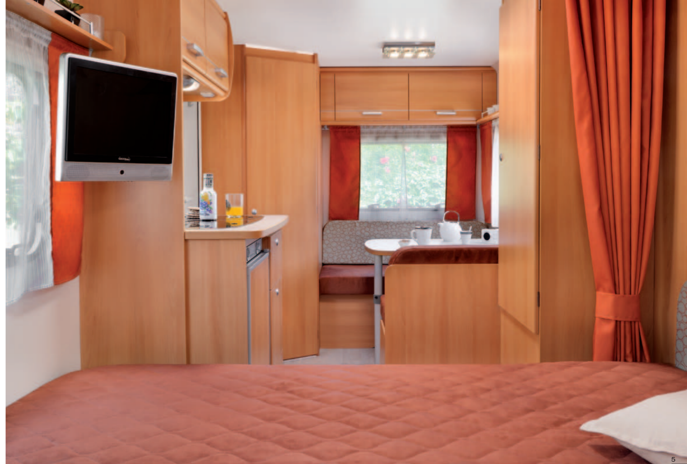
Antarès Luxe 390 "Florestan"