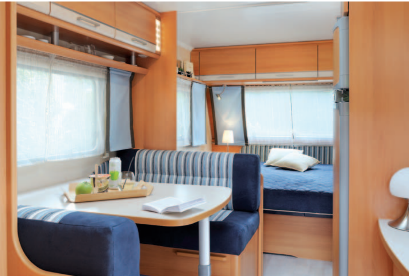
Allegra 485 "Azur"