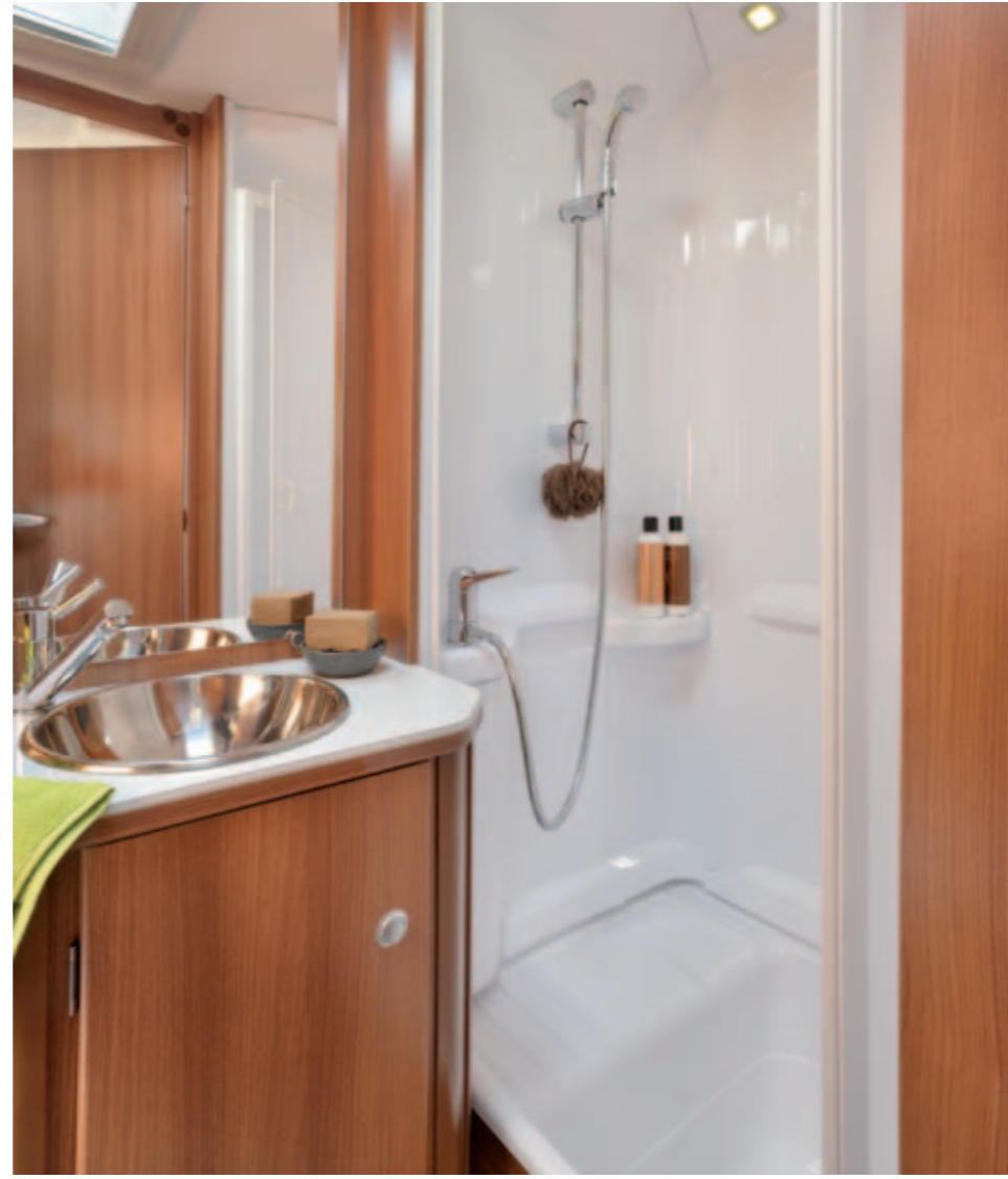
Venicia Premium 550