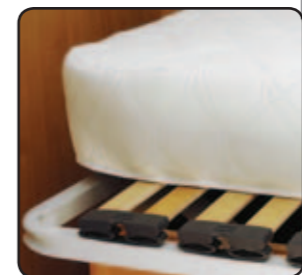
Matelas haute densité + sommier à lattes High quality mattress + Slatted bed bases