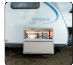
Portillon extérieur (sauf 485) Outside storage (except 485)