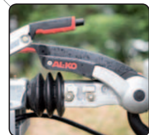
Stabilisateur anti-lacets ALKO Safety coupling