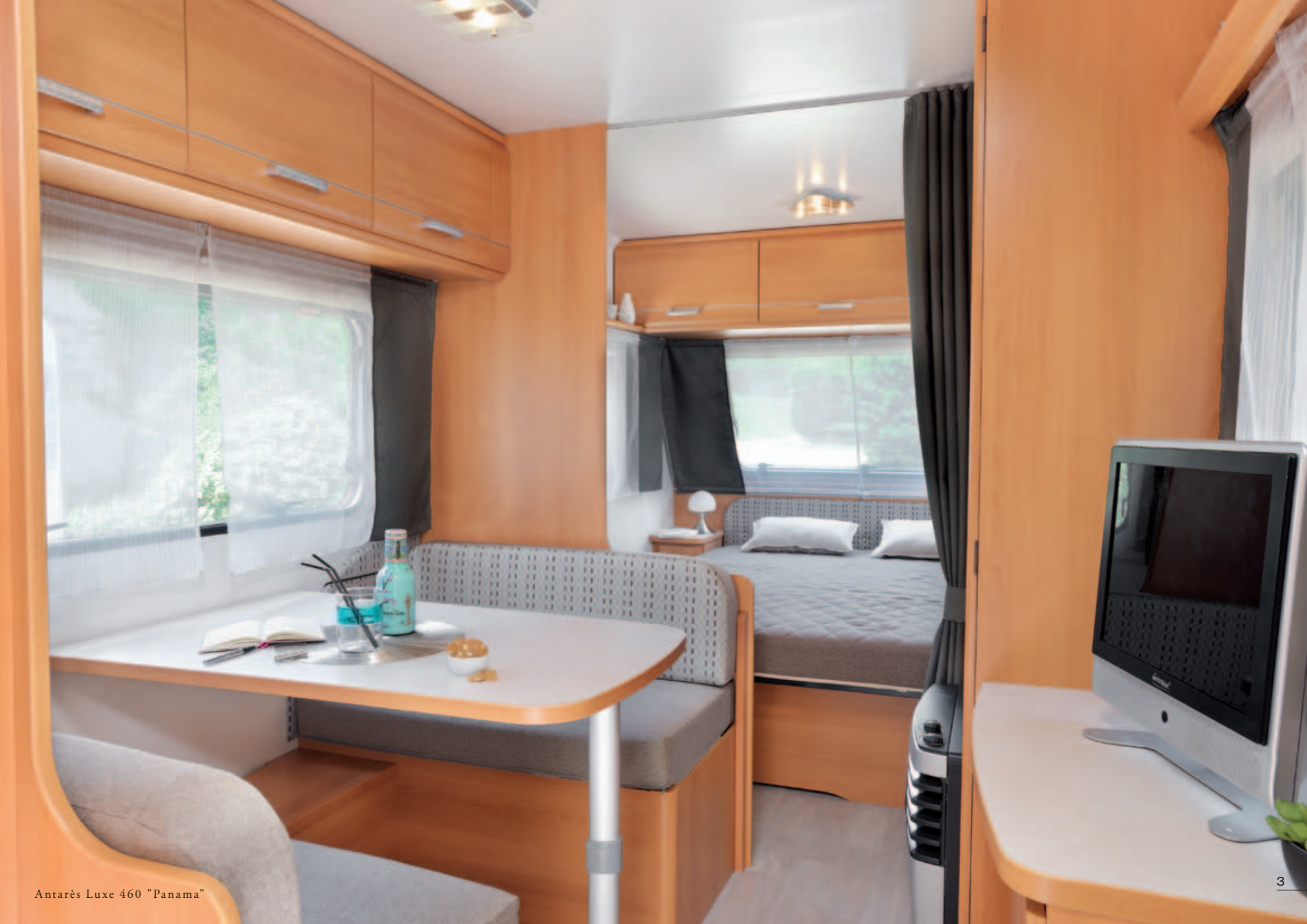
Antarès Luxe 460 "Panama"