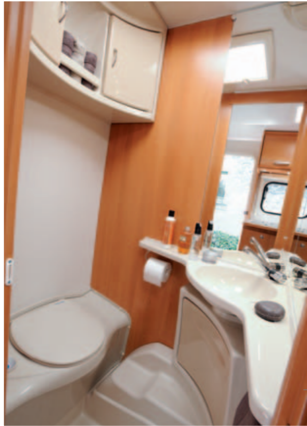
Antarès Luxe 380