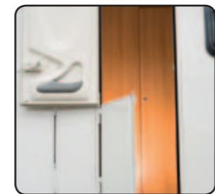
Porte à double battants Exterior 2-part door