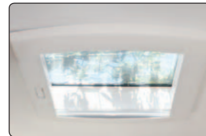
Lanterneau panoramique Panoramic skylight