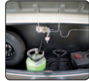
Coffre à gaz ABS front gas locker