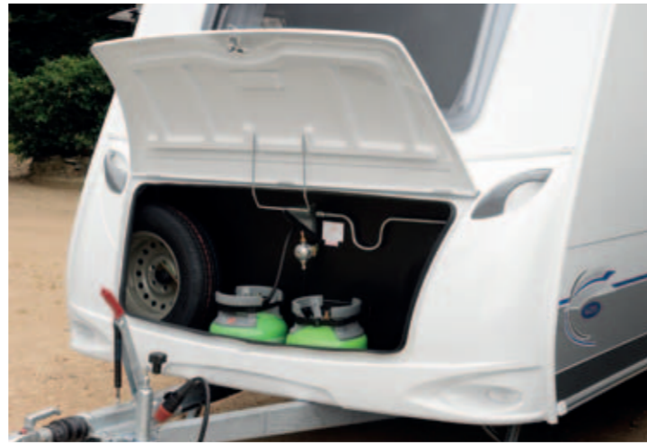
Coffre avant d'une grande capacité Large-capacity front gas locker