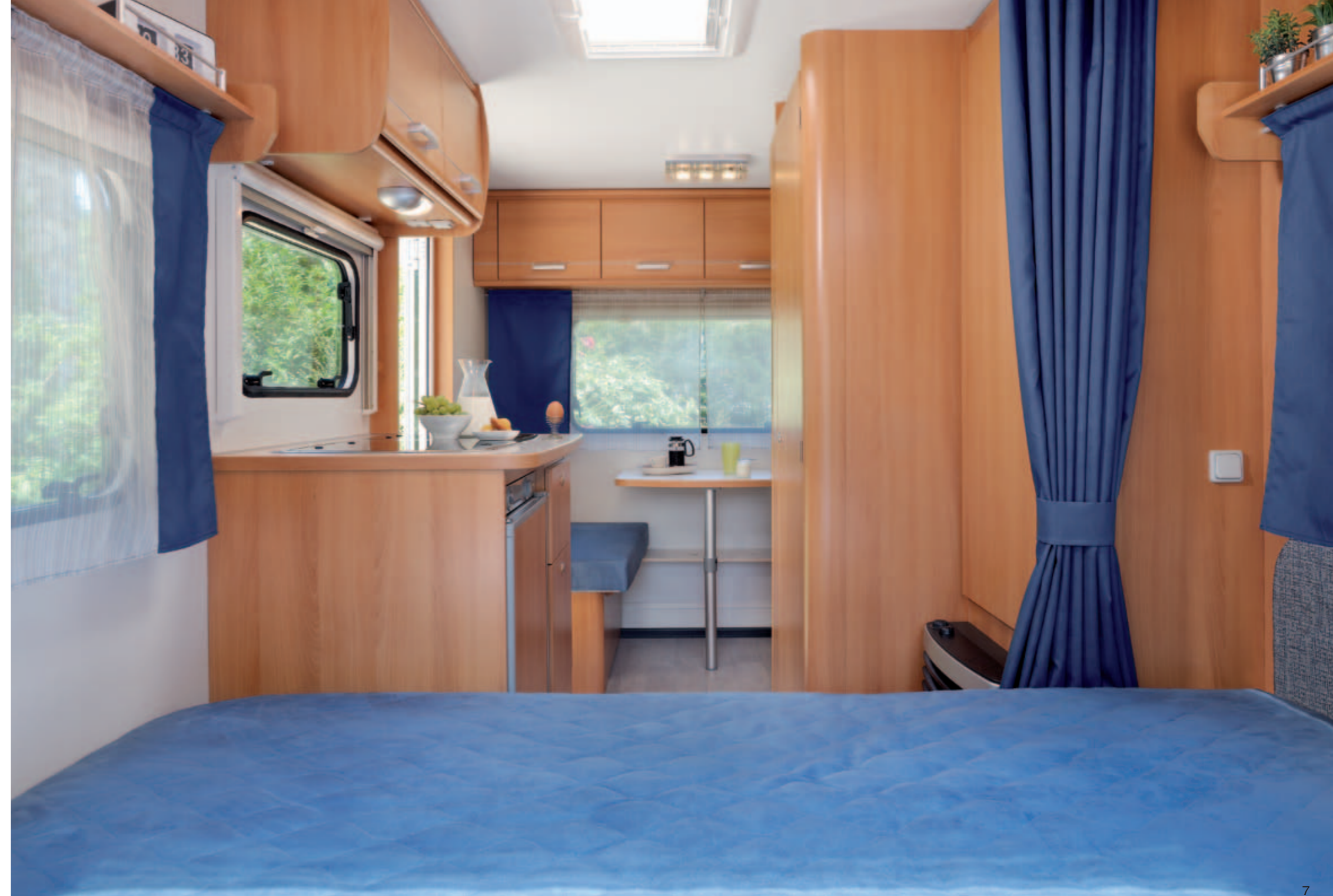
Antarès Luxe 380 "Denim" (chauffage en option)

* Option payante / Decor price supplement