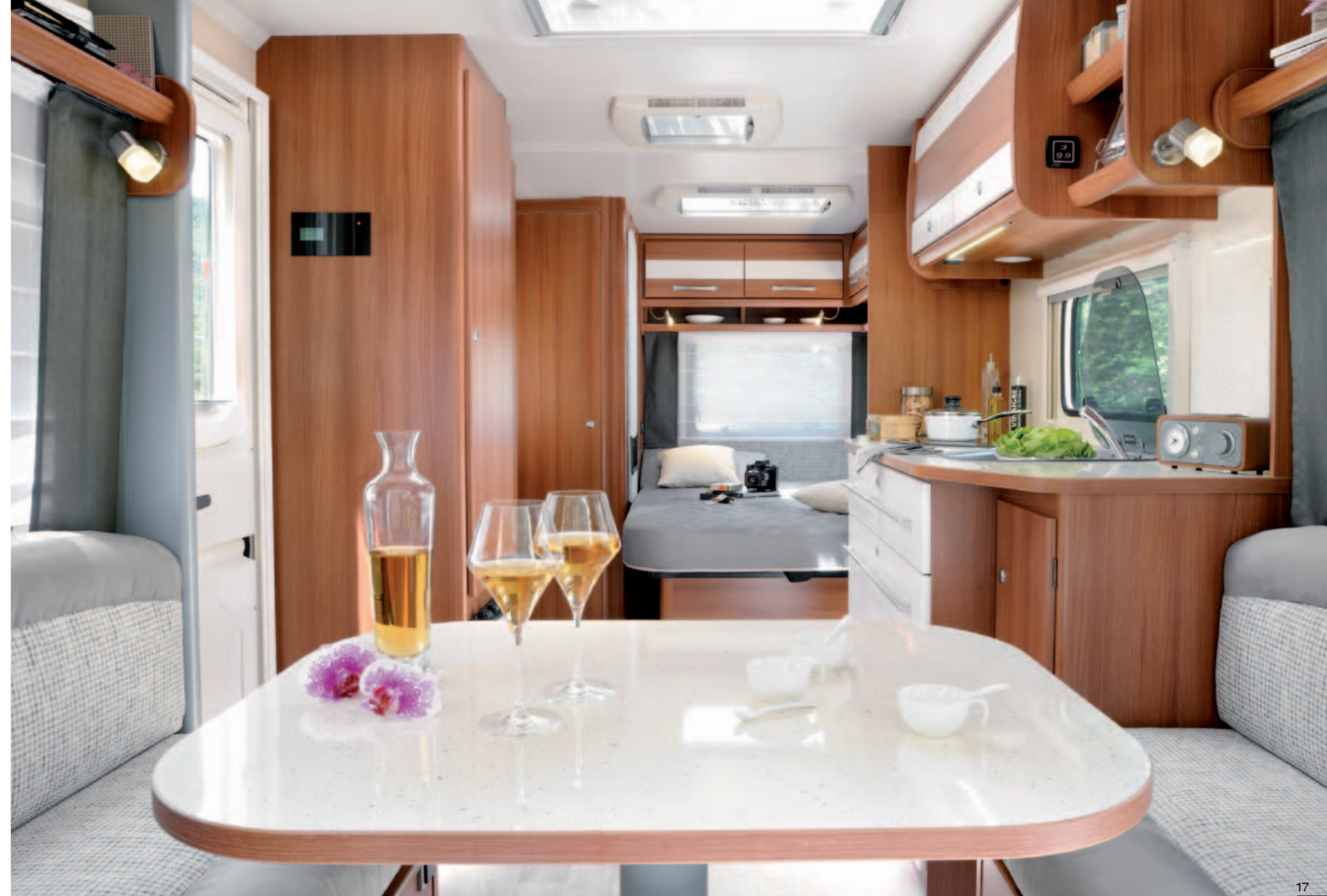
Venicia Premium 480 "Teramo"