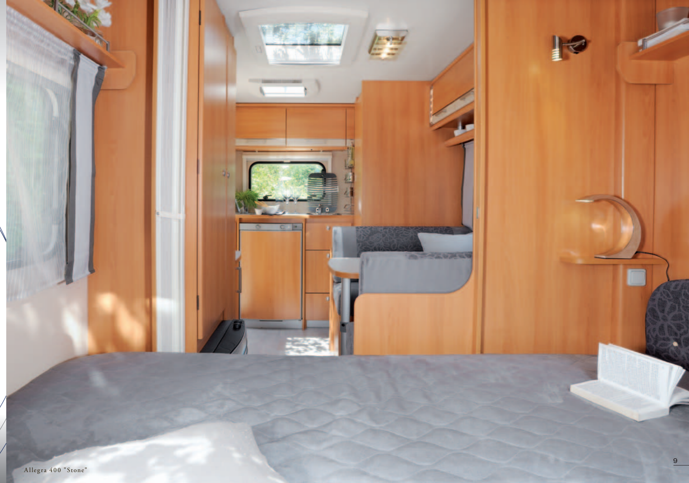
Allegra 400 "Stone"

+ Esthétique intérieure Interior comfort