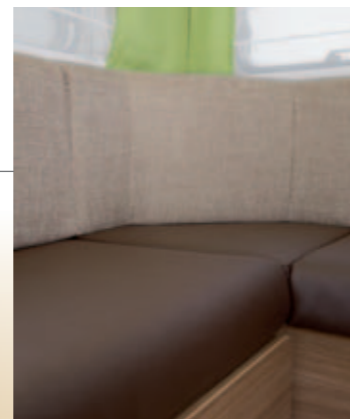
Aspect cuir / Leather look