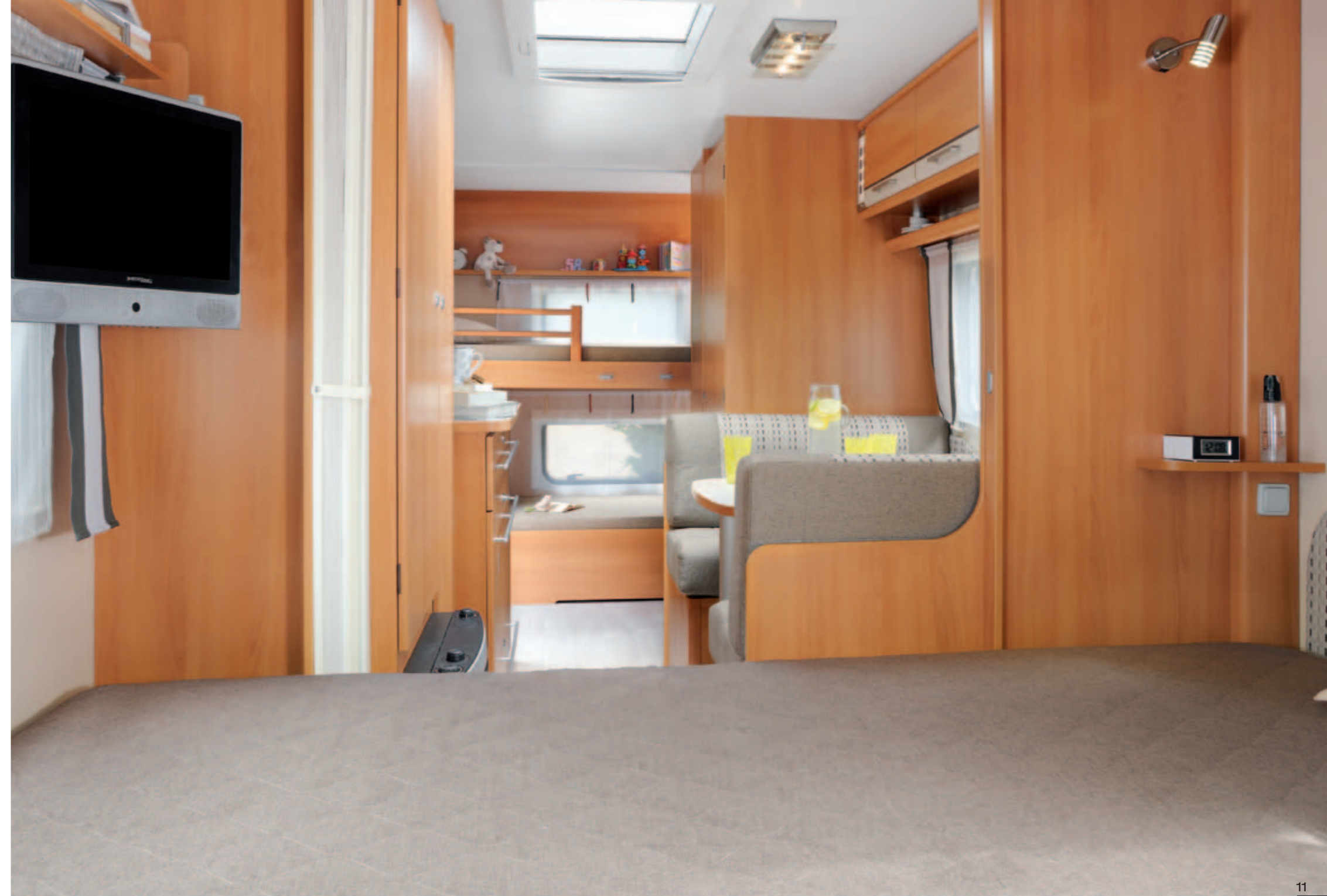
Allegra 486 "Bolzio"