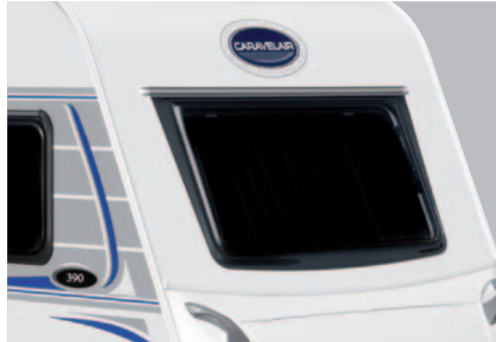
Toit en polyester lisse déroulé jusqu'au coffre avant Smooth GRP roof rolls down to the front gas locker