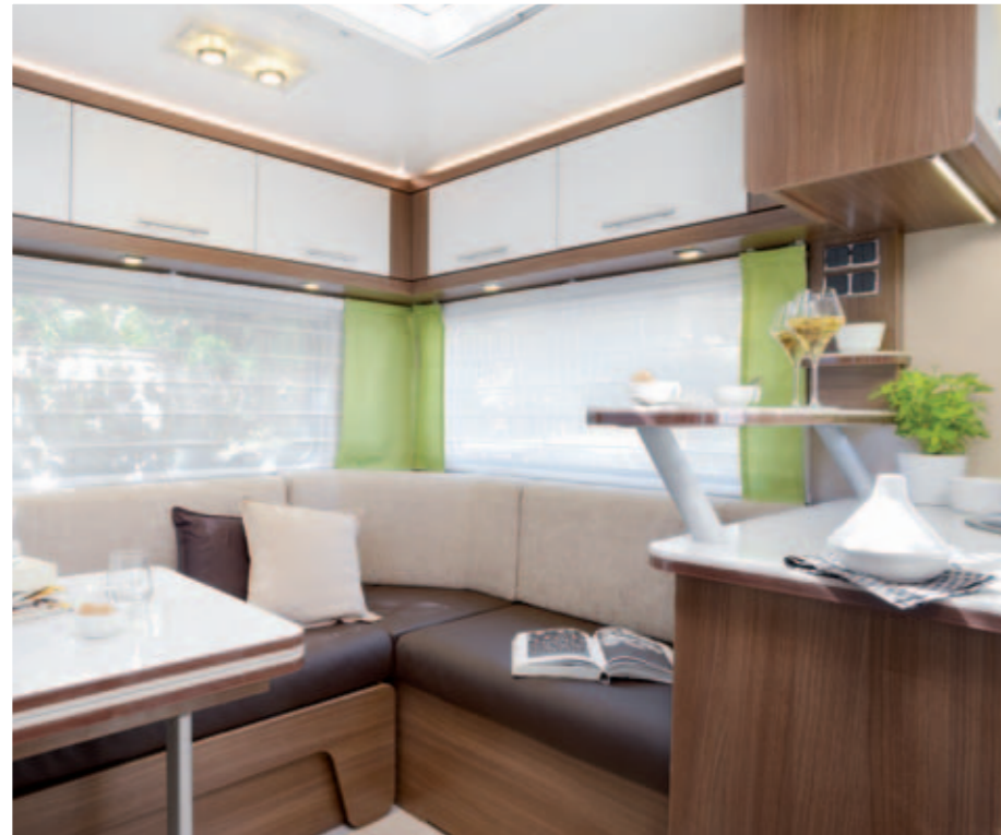
Serenity 500 "Capucino"