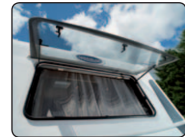
Toutes baies ouvrantes + baie avant panoramique avec combinés stores moustiquaire All Opening windows + Panoramic front opening window with combined blinds & mosquito net