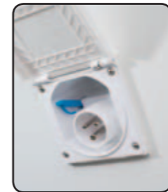
Prise extérieure (P17) Exterior socket