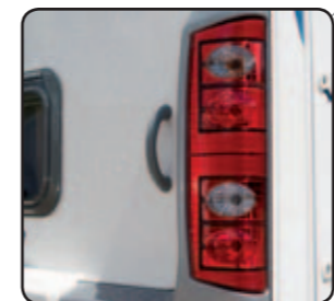
Feux arrières + 3 e feux de stop Rear lights + 3rd brake light