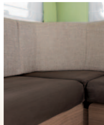
Aspect micro-fibres / Micro-fibres look

La palette des ambiances Alternative fabric choices