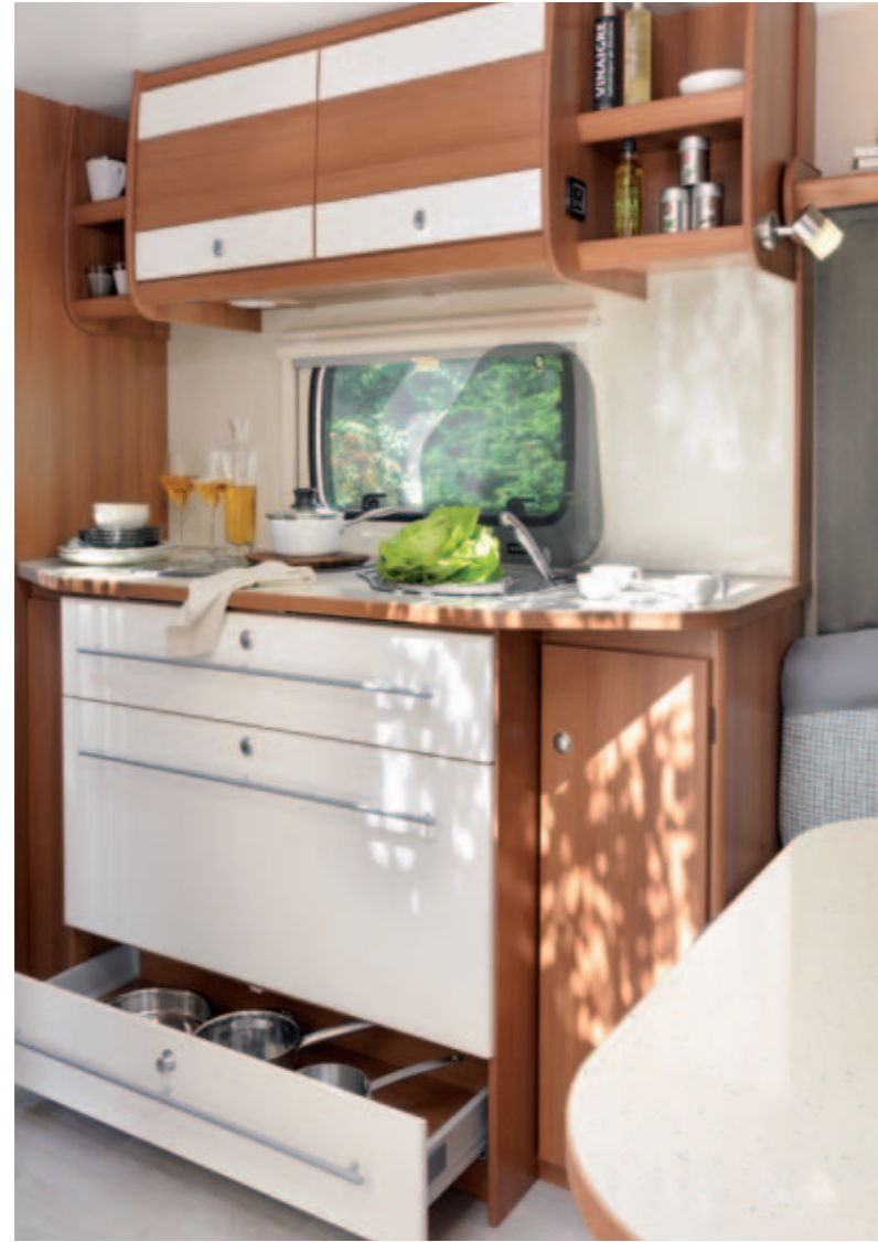
Venicia Premium 480